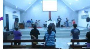
ACT ユースの礼拝でみぎわが ワースhipリード。