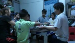
みぎわの夕飯風景。