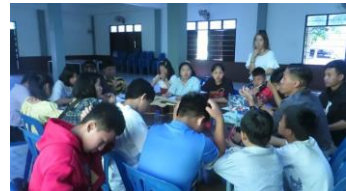
ジュンさん人気でユースが沢山集まったCS。